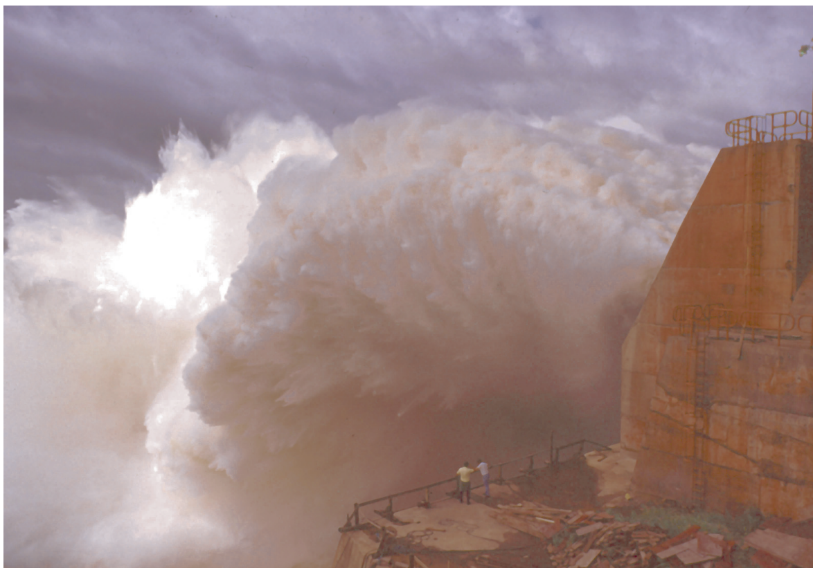
Una de las represas mayores del mundo: la planta hidroeléctrica de Itaipú en Brasil. El futuro e proyectos de este tipo es puesto en duda, según informes recientes